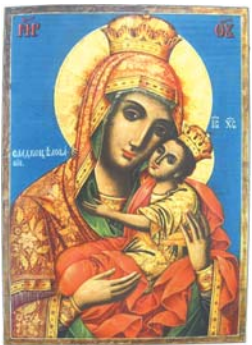
Св. Богородица Сладкоговезане. Икона от Никола Образцов, 1855 г.