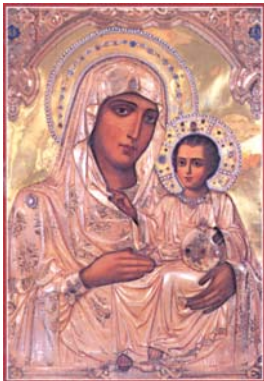
Иерусалимската икона (горе) и анонимното богомолство пред катедралния храм „Св. Александър Невски“, чиятоци би се поклонят

Разбира се, нейното первоначално физическо честване в България е неизменно от всички нас и би имало най-голямо въздействие. Аз го трудно мога да мога се осъществява всяка година поради независещи от нас факто-