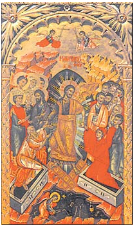
Възкресение Христово. Икона от септословския алтисър „Филотей“, Критска школа

Братя и сестри, Неизмеримо е Божие милосърдие към всички