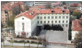
Сградата на Пловдивската духовна семинария

През учебната 1913-1914 г. Цариградската семинария се превръща в България. От 1915 г. тя се установява в Пловдив и през септември отгваря вре-