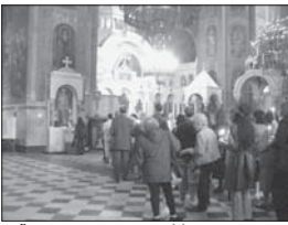
Богомошките, чакащи своя ред да се поклонят на св. мощи в камбианния храм

спарията. На 13 май в гр. Шумен с лътивно шествие мощите бива пренесени в храм „Св. Три светители“, където останка за поклонение и на следващия ден. На 15 май те бива пренесени във Варна за честванията на годишнината от основането на митрополитския катедрален храм „Успение Богородично“. Във Варна предстои да бъде изграден храм, посветен на св. ап. Андрей Първовизи, който според преданието е проповядвал в Черноморското крайбрежие и поставил за първенец на Варненска и Великорелска епархия. Св. Йоан Златоуст при свое