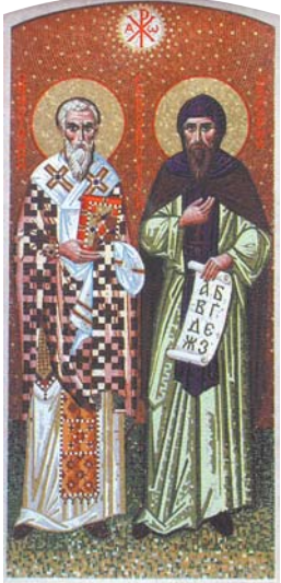
Мозаична икона на светите брата Кирил и Методий от южната фасада на храма в Пловдивската духовна семинария, 2002 г.