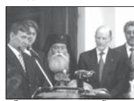
Ловчанския митрополит Гавриил и премиерът Симон Самкобурговски, Ловеч, 11 май 2005 г.

В наше време тази идея отново получава развитие. След демократичните промени през 1990 г. общинските власти строят катедрала в центъра на града. Поклонният вече митрополит Григорий, майка тогава в изградена възраст и болна, прави необходимите постъпки за общинска власт. Въпреки среща доста противници. По височко изглежда, че няма да е лесно да се осъществи парцел за строятелство на нов храм в центъра на Ловеч. След драматични поврати, уговорки и обещания, с решителни действия и настояване на икони Ловчанския митрополит Гавриил преобръща свещ и съ съдействието на тогавашния кмет, през пролетта на 2002 г. се взема решение да се продаде на Ловчанския митрополит парцел за строеж на нов катедрален храм точно в центъра на Ловеч. Решението е взето, но тъй като епархията е бедна, остава търпял проблем за събиране