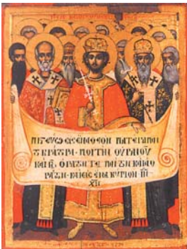
Първият Вселенски събор. Икона от Карплато, в Карей, столицата на Св. Гора, XVIII в.

В своето съчинение „Светло на Съборите и Армена в Иглия и в Се-