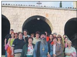
Варненски и Великопреславски митрополит Кирил с българската поклонническа група