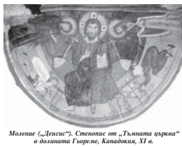
Малена „Дисерт“, Стенопант от „Тъмната църква“ а вълната Герлер, Каподокия, XI в.

И то, очевидно възникна парадокс – може да се молят, а да не вярват, а да вярват, а да не знаят за това състояние, а да не знаят, че молитвата съществува не в свързан с прошение, не е тяква безцърковно – множествено форми и съдържаща цялото съвърхово човешка пречелна мю живот и вяреска вой мюг, тя е съвлична и възможна по всяка на-