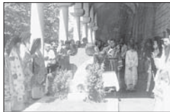
Панорама на гроба на екарх Йосиф, 12 юни 2005 г.

Първоначално са 90 години от блажната кончина на първият български Екарх Йосиф I, който блязо чести дестелства възлагане държавно-политическия разделение дивотел на единията Българска църква и оцелителство единството на българския народ, за Казано той ще остане завинаги едн един изречен гърбуротел.