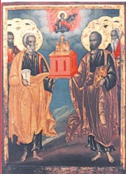
„Св. ап. Петър и Павел“. Икона от втората половина на XVIII в., Св. Гора

Затова развийте се, макар сега и да поскарбите молитво (ако е потребно) в различни изкушения, та изпитанията виша вера да измече по-просвещена от неприятели, макар и чрез ови изпитания זאת, за гловина и чести и слава, как се яви Иисус Христос, Казано обичане, без да се бои по видене, и в Казано вярвайки сега, без го вярвайте, разбийте се в неуклане и пресловият росорит, като постанете края на вашата вера – спасението на душите; за това спомане направих издворения и изследвания пророците, като предказаха за дророната воя белезот, като изследвах, как и какво време е пословил Христият Дух, като беше в тях, Казано Той е предвестил Християте страдания и изречата своя тв съба; там бе открито, че не на тв съмате, а нем слушане онова, Казано сега Ви е проповядвано от ови, Казано Ви са белезостите чрез Духа Светаго, пророчан от небесата, и в Казано Жаката го наричават Ангелите. (Първо събрано послание на св. ап. Петър, 1:5-12)