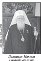
Патриарх Максим с почетно отличие

патриарх Максим благодарил за високото отличие. Официално поздравление поднесе посланикът на Руската федерация в България, обласен съветник на Високата руска обществена награда е учредена през 2002 г. Тя се връчва за особени заслуги в областта на държавното управление, културата, промишлеността и спорта. Неин пръв лауреат е руският патриарх Александър II.