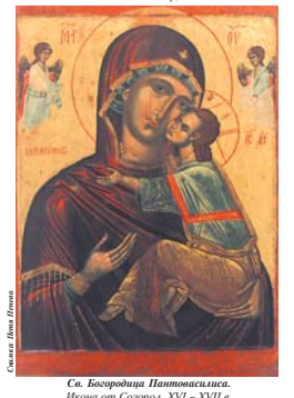
Св. Богородица Пантократорка.