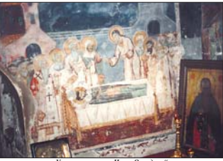
„Степанета на св. Наум Охридски“

често публикувана от три страни с теми с кръстеното на златерата на царя“, извършено от св. Наум.