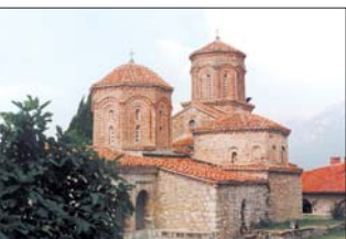
Главният храм на манастира

При основаването на историята на манастира „Св. Наум“ в съвременните историци често срещем у авторитетни източници твърдения, че „средновековните сурди на манастира били разничени в края XVIII век при феодалната разничила в Османската империя от Али паша от Янина. Предилокази, че е по смисла в кляво вярване основи си издигнали нова църква и жилищенят сурди, а в изпълнението старият храм XVIII век Вероятно по онова време действително е имало нападения, ограбвания и може би разрушения в западните стени. Но това не може да се твърди за главния манастирски храм. В него е запазен непокътан прекрасенят параклис на св. Христо от 1711 г. Съхранени са на високата местачливи фрагменти от стенописи, правени в първата XVIII век, така че в края на XVIII век не може да има издигане на „нова църква“, което да е станало „дър старо основ“. Тогана е станало само обноваване и основно ремонтансе на стария храм. В него са съхранени много архитектурни елементи, които са запазили своето значение и практика по времето на св. Борис (IX-X в.) – например т. нар. „трибунски“ (композиция от две колони и три арки) между иконостас и иконостас. Вързу теми две стари колони има издълбани графити, някои от които въздъхват и гласовито бучат. Проф. Иордан Иванов твърди, че тези надписи „де се очиват по първата половина на XIV век“. И тук следва Младешко. Това е значаен свидетелства употреба на двете старите