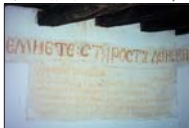
Част от поучителните надписи по списъците на училището

Към края на 18-и век сред населението от Белорачишко се чувства необходимост от религиозна просвета, която да съхрани и направи национален дух в етос. По това време (около 1790 г.) за селеник в с. Рабиша има грамотни поет-писаник в с. Рабиша има грамотни поет-писаник в с. Рабиша. Той пристига от гр. Неготино и от много дати и проповядва дело в селото. В началото на 30-те години селските първенеци измолват от турските власти заедно с разширяването на селската черква „Свети пророк Илия“ да построят в нейния двор и пристройка за просветни нужди. През 1833-1834 г. сградата е построена, а от следващата 1835 г. килийното учи-