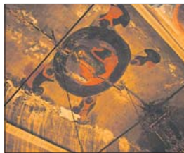
Пукнатината в купола на църквата