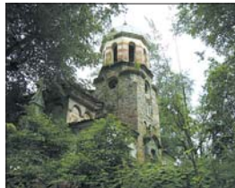
Общ изглед на храма