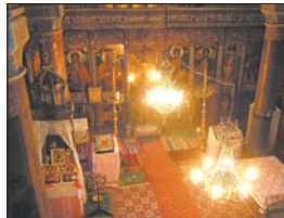
Изпиркват на храма

Храмът „Рождество Богородично“ ели осветен през 1847 г. Забеля църковната камбанария, отворено врати училище... Но скръпан 159 години, села млади СБ-ващото село, да рече. СБ-ващото село, пълноценно, пълноценно, пълноценно с кервачи орна в четирите ъъла и змеюве в средата на корнана на северната и южната страна.