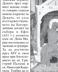
На 8 септември Православната църква отбелязва един от големите си празници – Рождество на св. Богородица