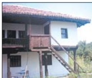
Сградата на килийното училище

Село Рабиша със своята чудно красива пейзаж „Магур“ е един от най-често посещаваните туристически обекти в Северозападна България. Матинца туристи обаче знае, че недалече от природните курорти на Магурата се е намирало до наши дни килийното черковно училище в село Рабиша, едно от онези на родолюбив и нравствен, възпитано поколение българи през Възраждането.