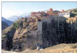
Манастир „Великия Метера“