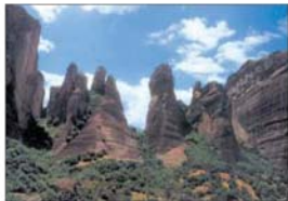
Скалите на Метера

На следващия ден ние от туристическата група събраха смелост и се изкачиха в още студентите водни на Егейско море, останалите се примираха с разпока по планината вива. Преди тръгване отивахме посетиме манастира на св. Фотиния в Катерино. На нивото от нас не му се искаше да си тръгва веднага, защото от нас, и по не след кратък престой и разпока в град Серсера