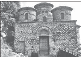
Византийска базилика от XI в., град Свита в Калабрия

ват все по-широко разпространение. Особено съществителна и агресивна е иконостасът „Сиднеята на Скития“, която се разпростира на мялностинно и сред смъртностите.