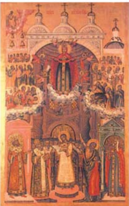
„Поклон на Пресвета Богородица“