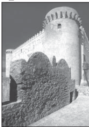
Заедно на Свита Северина, излизан от норманите в края на XII век.