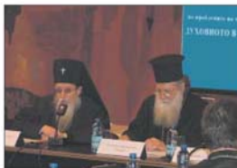
Митрополитите Иоанникий и Неофит в елка участие на Кръглата маса на тема „Духовното в живота на младите членове“ в ИЦК на 23 ноември 2005 г.

Земният живот на човека преминава в постоянна борба. Борба между доброто и злото. Затова и в настъпването на св. ап. Павел: „Бъдете бодри, стойте във вярата, бладе мъжествени, бладе крепки“ (1 Кор. 16:13).