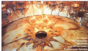
Богородица с новородения Христос, св. Йосиф и св. св. Младенци Христос

Руска икона от първата половина на XVIII в.