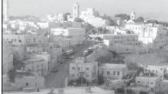
Направен изглед от град Витлеем

Тимитате, за да го обособи (2 Цар. 23:14-17). Затова Витлеем останал в историята като град Давидов.