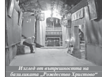
Изглед от вътрешността на базиликата „Рождество Христово“

нищете на мъчениците за въртата, а дася по-късно – Рождество Христово.