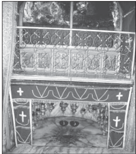
Натаната в Рибин, в издигнат явруст, наведено, където се е родил Спасителят. Вързу него е изобразена сребряна звезда

Евангелист Матей съпъра поклонението на мъдретите от Итос с особена звезда, която ги накарала да покат това дълго и трудно пътуване и ги напътяла къде да търсят новородения Цар. Има различни теории за естеството на тази звезда. За сии това е комета, за други (напр. Ориген) това е т. нар. Нова звезда. Но като че най-убедителна е теорията за т. нар. конюнкция, или приближаване на две небесни тела едно до друго, обединяващи по този начин светлината си.