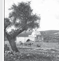
Местото, където е погребана Рахел

Пещерата в която се е родил Младенецът Христос е намираща хълмът в източния край на Витлеем. Известно е, че оше през IV в. имп. Константин Велики е изградил на негово място прекрасна базилика. Макар и многократно претърпявано през вековете, предполага се, че в общи линии това здание се е запазило в първоначалния си вид и до днес.