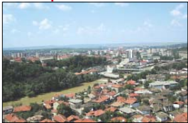
Панорамен изглед от гр. Ловеч