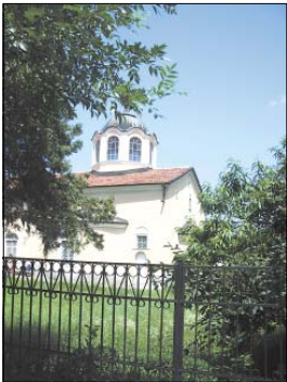
Катедралният храм на Ловеч „Св. Троица“