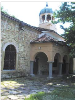
Храм „Успение на Пресвета Богородица“

ватено в стиса багровост. Сигналите по ритъм са стандартни, но звученето им създава особено рода камбанен комфорт.