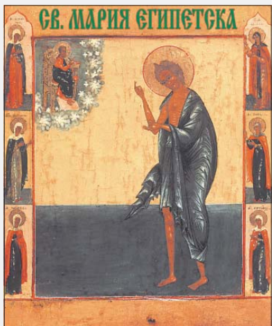
„Св. Мария Египетска”. Руска икона от XIII в.

Св. Мария Египетска била извест- на в слорочния си живот жите- лка на Александрия. Един ден пожела- ла да се покони на Живоначалния Кръст Господен в Йерусалим. Въпреки своята греховност, въпреки, че жи- вотът ѝ нямал никакво общо с оная Бо- жествена чистота и любов, на която искала да се покони, тя дръзнаво пристъпвала към вратите на храма за- едно с другите поклонници, но нака- ва невидима сила не ѝ позволивала да пристъпва прага. Това я стреснало и тя осъзнала нищетата на блудния си жи- вот.