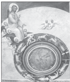
към материалния свят.

Постът ни учи пръв всичко да се отнасяме по-бавно към нашето тяло, с всичките му потребности и желания. С помисъта на поста изучаваме тялото си да е уместно в духовния ни живот, за да стане то, използвайки думите на св. Максим Изповедник, „местител на света“. Нашата цел не е потискането на тялото, а неговото преобразяване. Ако правим различие между аскетизма – това не е борба с тялото ни, а за нашето тяло. Чрез аскетично въздържане ние потвърждаваме материалността на тялото, но същевременно се стремим да духовизирам тази материалност. Аскетизмът не означава, че отрягаме законното удоволствие, което получаваме от храненето, а също и в рамките на семейството – но на значително по-дълбоко ниво – от физическите отношения. Ограничаването на храната и въздържането ни помагат да се освободим от страстите и конжевите, за да се ориентираме от средство за удоволствие в израз на междучелностно общуване.