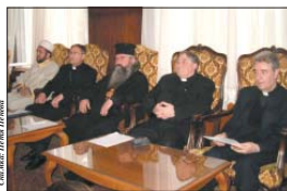
Варненския митрополит Кирил в разговор с представители на различни вероизповедания в България

На 28 март в Синодалната палата се проведе средна на религиозните водачи на основните вероизповедания у нас. Форумът беше свикан по инициатива на Св. Синод на Българската православна църква и бе ръководен от Варненския и Великопреславския митрополит Кирил. На срещата бе взето решение от страна на представителите на основните вероизповедания у нас за създаване на инициативен комитет, който да заседава постоянно и да определя темите на бъдещи съвместни инициативи.