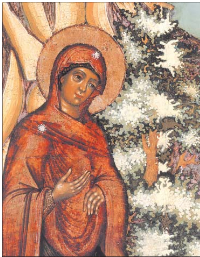
„Язвненето на Божицата Майка и св. Николай на класира Георги“, детайл. Руска икона от 1705 г.