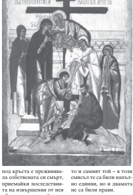
Да споделим с Христа страданията, разпийт им и смъртта Му

Обичаме, когато любовта ни е толкова силно способни да споделим и страданията му като собствени. Чрез любовта ставаме единни с този,