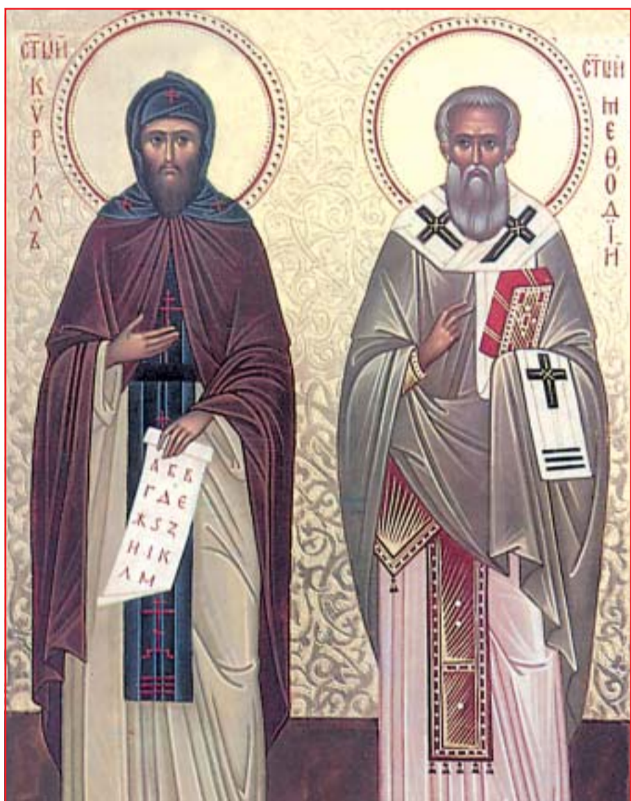
Светите равноапостолни братя Кирил и Методий