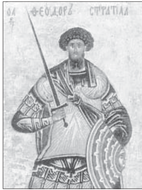
Св. Теодор Стратилат