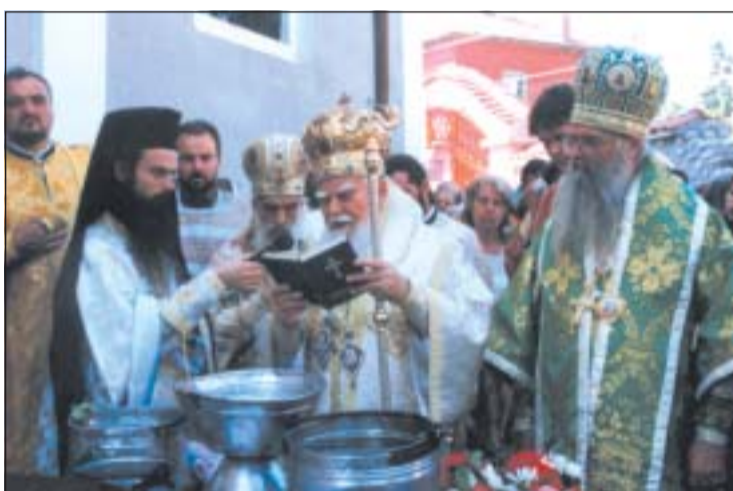
Патриарх Максим и придружаващите го духовници по време на тържествата по случай 100-годишнината от осъществяването на радуилския храм „Рождество Богородично“

През 1918 г. ревностните радуилци успяват да си издействат свещеник, родом от Радуил. Разказват, че цар Фердинанд често гостувал в селото. Възползвали се от една от визитите му, за да се оплачат, че от години си нямат постоянен свещеник. Измолват от царя да освободят от фронта местно момче – Стоимен Илиев Джалов, за да им бъде ръкоположен за свещеник. Цар Фердинанд оказва съдей-