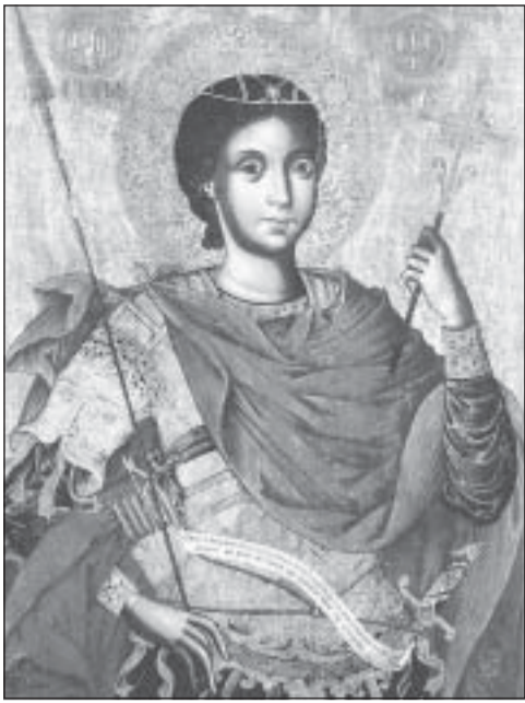
Св. Георги Победоносец