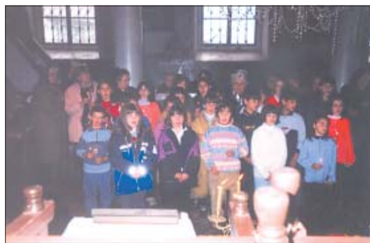
Деца от училището в с. Радуил изучават предмета „Религия“ и вземат активно участие в живота на енорията

Първоначално пътува от София, където живее семейството му. Но за да може постоянно да е в селото, радуилци построяват сграда, в която да живее (на мяс-