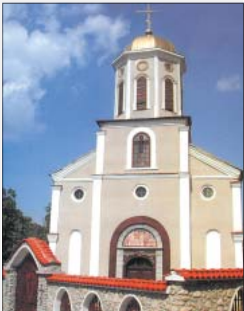
Енорийският храм „Рождество Богородично“, основан 1900 г.

А над всички е Бог, Който прави да израсте (вж. 1 Кор. 3:6) и Който праща на добрата нива добри стопани, защото трудно се създава, а твърде лесно се разпилва създаденото.