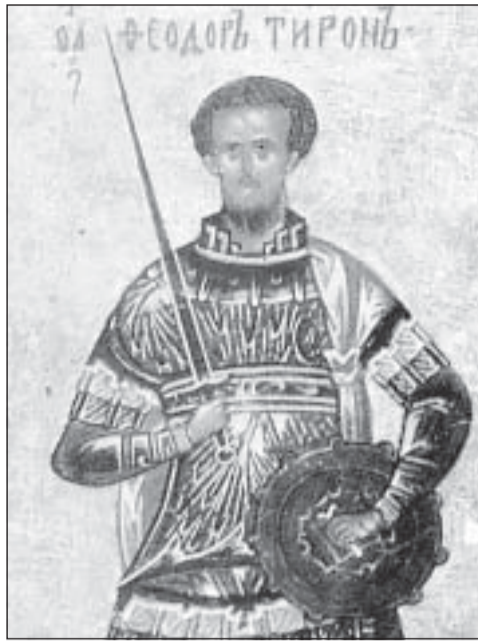
Св. Теодор Тирон