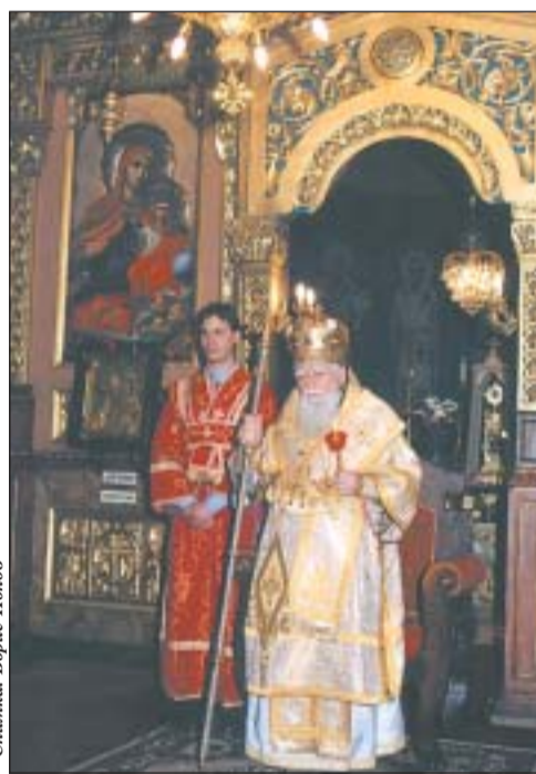
На Второ Възкресение Българският патриарх Максим оглави службата в столичната митрополитска катедрала „Св. Неделя“

По време на пасхалната полунощница Българският патриарх и всички