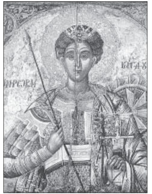
Св. Димитър Солунски

Във всяко богослужение, включващо Велика ектения и на Великия вход на св. Литургия свещеникът или дяконът отправят прошение за христолюбивото войнство . „Христолюбиво войнство“ се нарича сонмът от светии, които по един или друг начин са „воювали“ за вярата си в Христа и са удържали победа: кой с мъченичество, кой с изповедничество, кой с подвижничество или с апология на Христовото учение. „Христолюбиво войнство“ се наричат и воините-християни, които служат във войската и се стремят стриктно да изпълняват закона Христов.