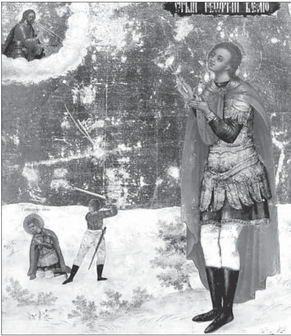
„Св. Георги със сцена от мъченическата му смърт“. Руска икона от XIX в.

Този велик Христов мъченик живял и пострадал по времето на римския император Диоклетиан (284-305). Още юноша, Георги постъпил на служба в императорската войска и едва 20-годишен достигнал до чин военен трибун (началник на легион). Бил красив, умен и способен младеж и императорът го направил и член на държавния съвет, без да подозира, че той бил християнин. По това време срещу християните били повдигнати люти гонения: залавяли ги, затваряли ги в тъмница и ги подлагали на страшни мъчения. Понеже младият Георги бил наследил от покойната си майка голямо богатство, наредил робите да бъдат освободени, а имотът и парите раздадени на бедните. Така той се подготвил за велик подвиг в името на Господа Исуса Христа.