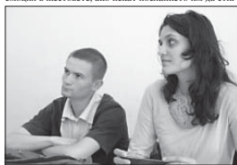
Студенти учащици в курса по жезтовия език не до свършата на глумци хора.