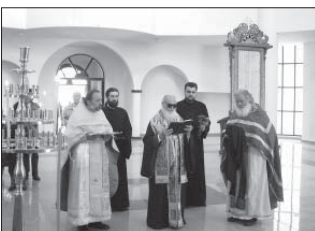
Посвещаване на Пловдивския митрополит Арсеней и четинето на подпастималните молитви