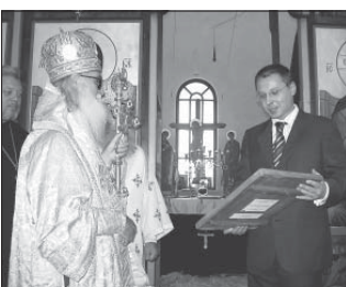
Министър-председателят С. Станишев поднася в дар на храма икона на св. Богородица