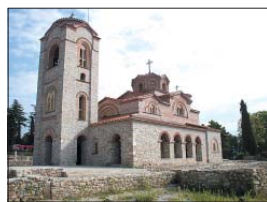
Храмът „Св. Климент Охридски“, в който се съхраняват мошете на светеца