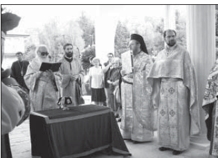
По време на литийното шествие пред западната страна на храма