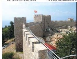
Светицхovelita крестот на Озир