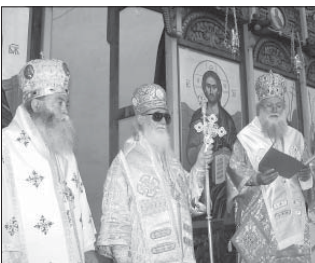
Руският митрополит Нефодий (вляво) пропраща поздравително слово от имено на Игнатов Светишество Българския патриарх Максим и св. Синод на БПЦ