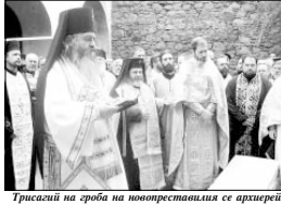
Триасий на гроба на новореставрирания архiereи