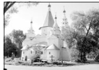
Храмът „Св. Троица“ в московския квартал „Голенищевски“