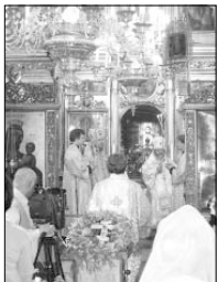
Св. Литургия в Българското повдигне бе отслужена от Вселенският митрополит Григорий