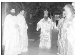
Митрополит Кирил отслужи заупокойната си Литургия