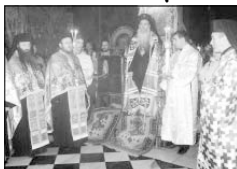
Митрополит Натанаил с архимандритите Наум, Виталий и Варлаам по време на освещаване

Част от християните, дошли да почетат прав. Ион Рилски, участват в богослужението в храм „Успение на св. Ион Рилски“, който се намира при гроба на светца. Там