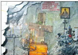
Първата отилическа пещера на св. Йоан Рилски над родното му село Скрино