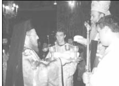
Митрополит Натанаил благославя петехлабесто по време на Божеството