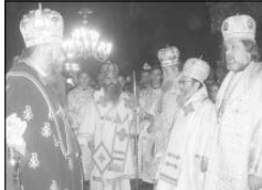
Архидяконите по време на празничната св. Литургия, оглашена от митрополит Кирил