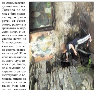
Лялото при гроба на св. Йоан, където хладно поклонници идват и молитва и благослов

С у а и а! и словото му простичките хора, разбират думите му. Почувствали необходимостта да бъдат близо до него и далеч от алчния и жестоки свет.