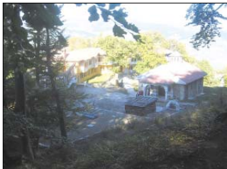
На мястото, където започна монашеският подвиг на св. Йоан, е изградена мялжа св. Обители – Руенският манастир „Св. Йоан Рилски“