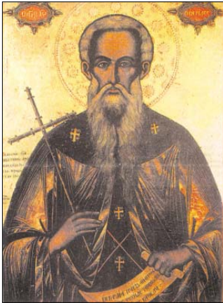
„Св. Йоан Рилски“. Икона от Рилския манастир, 1789 г.

Житиенските разказва, че когато Пустиниожителат пределят своето отминаване от този свят, заръчва на своите ученици, а чрез тях и на всички останали, да не скръбят: „След моята смърт