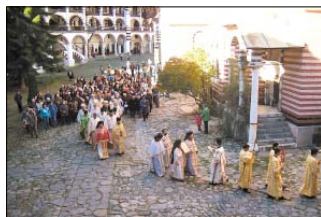
И тази година празнествата събраха много божовници и миряни в Рилския манастир, основан от светеца

За св. Йоан Рилски имаме малко сведения. Не знаем с точност дори годината, в която е роден, а и изчисляваме според факта, че той починал