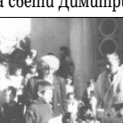
Празникът на свети Димитрий в Гложене.