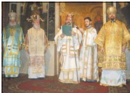
Приветствие от името на Св. Синод на БГП поднесе Варненският и Великопреславски митрополит Кирил