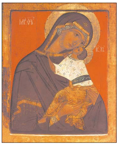
„Св. Богородица – Умишница“. Руска икона от XVII в.

СВ. ЕВХАРИСТИЯ – ЕДНО НЕПРЕСТАЙНО ЧУДО стр. 7