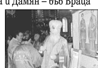
Мощите на светиите бесребреници и чудотворци Козма и Дамян се остават в катедралния храм „Свети апостоли Петър и Павел“ във Враца през зимата на миналата година.

Светиите бесребреници и чудотворци Козма и Дамян се честват от Православната църква на 6 ноември и се считат за закрилници на тежко болните. Нама писмен дарители и някои не си спомнят откога датите на светиите са административна манастир „Св. Успенският Метростично“, съобщил изписане му отец Харитон. Према се, че реликвите се съхраняват там от столетия.