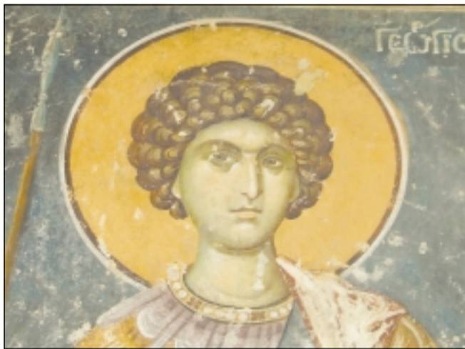
„Св. Георги“ – стенопис от XIV век

Тук през Средновековието бил основан манастир, от който днес е останала само църквата, която е енорийска, а големият ѝ двор е изпълнен с надгробни паметници. Според легендата в една близка пещера се подвизавал преподобният Прохор Пшински, българин по произход от областта Овче поле. Веднъж той срещнал един ловец, когато казал по име и му предсказал, че ще стане голям владетел. И след известно време този ловец седнал на византийския императорски трон. Това бил Роман IV Диоген (1067-1071), който построил първоначалния храм. Неизвестно кога той бил разрушен, а го възобновил през 1313 г. сръбският крал св. Стефан Урош II Милутин (1282-1321), чиито мощи се намират в софийския катедрален храм „Св. Неделя“. За това съдим от ктиторския надпис, написан на старобългарски