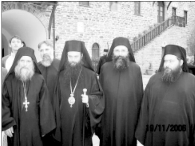
Гостите от България бяха братски приети от монасите в манастира „Кутлумуш“

Като отпочинахме, взехме молитвено участие във вечерната служба, а след това, по милост Божия, се сподобихме да се поклоним на: част от даровете на влъхвите, частица от Светия Кръст Господен, светиите мощи на лечителя св. Дамьян, св. Калиник, св. Василий Велики, св. Григорий Богослов, св. Максим Исповедник, св. Нектарий Егински и св. Пантелеймон. Изуменият манастир ни оказа честта да отслужим полунощницата, утринната и светата Литургия, която започна към 3 ч. през нощта.