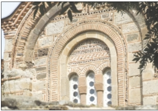
Архитектурни орнаменти по южната фасада