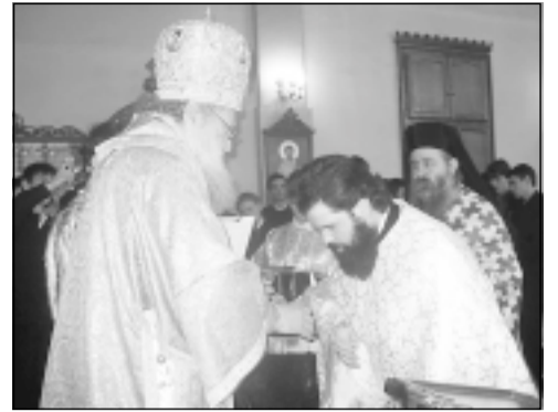
Накрая митрополит Неофит лично причасти семинаристите и множеството други богомолци.

В св. Литургия взеха участие архим. Сионий, ректор на СДСеминария „Св. Йоан Рилски“, йером. Поликарп, игумен на Руенския манастир „Св. Йоан Рилски“, и йером. Стилиян, игумен на манастира „Св. Петка“ в с. Бистрица, София, духовни братя на архим. Антоний, както и много свещеници от Пловдив и епархията.