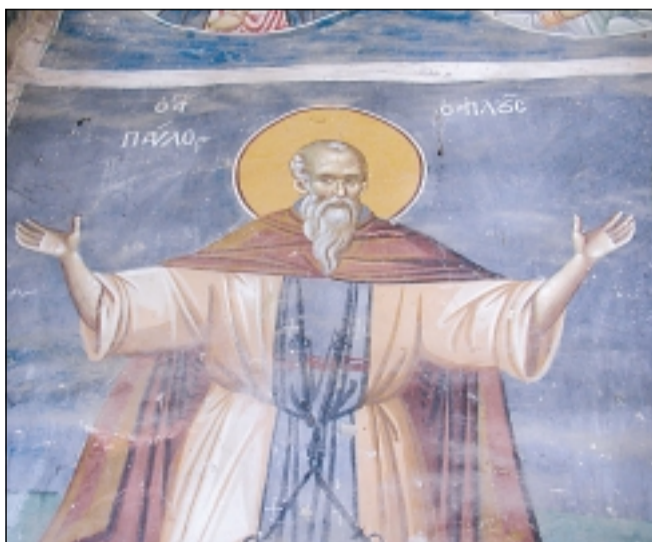
„Св. апостол Павел“ – стенопис

език, защото и тукашното население било българско. Той е издълан на правоъгълен камък, поставен над западната църковна врата.