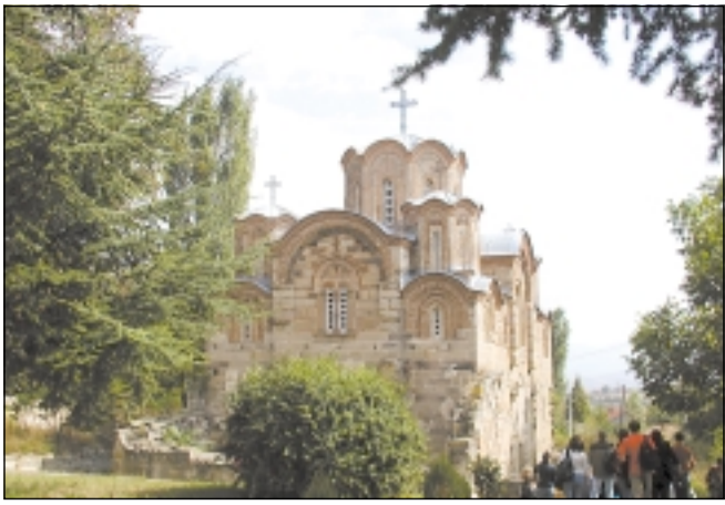
Общ изглед на църквата „Св. Георги“