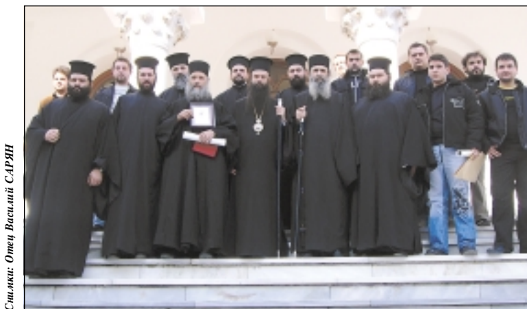
Църковната ни делегация с домакините пред сградата на Светия Кинопис в столицата на Света Гора – Каряя