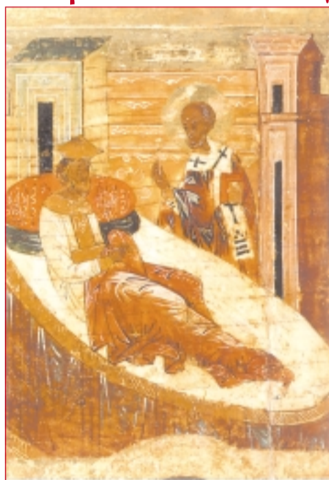
Сцени от житието на св. Николай. Детайли от руска икона, XVI в.