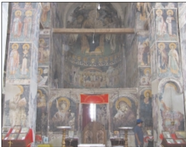
Вътрешността на храма