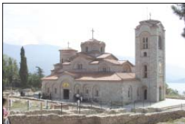
Подножието на св. Климентов храм „Св. Пантелејмон“

Днес църковите старини в Охрид са мнозобројни и не вслнски доапно добро проучени. Старият Климентов манастир „Св. Пантелејмон“ проследуваб од рана, на XV в., когао црквата му била пребрњат от турските завојателот в дрќама (Имарет дрќаме-си). Така грќаме проследуваб од Јан 2000 г., когао била соборена и на неао мјсто в нест на 2000 години от Ројдестот Христово била вазобновена старата манастирска црќа. Моште на св. Климент били пренесени в црќата „Св. Богородица Перувелита“, построена през 1295 г., на хма на стария град. Импозабта на започнала да се нарња и „Св. Климент Охридски“. След освещаването на новата црќа, построена на мјстото на Имарет дрќаме, моште на св. Пантелејмон и св. Климент“ в вора на старата црќа „Св. Климент Охридски“ (паза на хма на стария град) се намери била свјант зрба. Пред вора в този на Охридски екархийски митрополит Методиј, починал на 10 декември 1909 г. А за црќата в поребан формат Водокрески ден „поет, патриот и уште!“ Грозир Първичеб, починал на 25 јануари 1893 г.