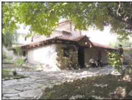
Църквата „Св. Богородица Балчик“

В непосредствена близост се намират ове четри маќи средновековни црќи. Пред вора на т. нар. Климентов комплекс в црќата „Св. Димитър“, построена през XIV в. и дрќаба от цар Борис III при гостувањето му в Охрид.