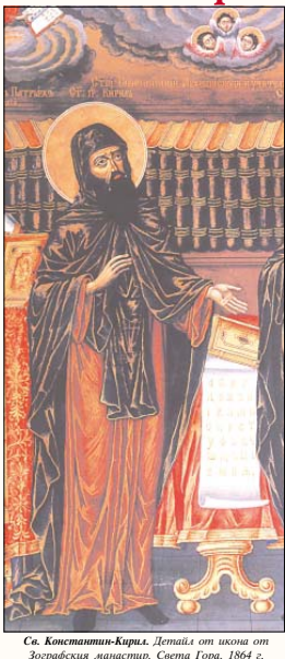
Св. Константин-Кирил. Детайл от икона от Зографския манастир, Свита Гора, 1864 г.

Акогато найблизо часът да приеме покой и да се представи във вечните жилища, като поведна ръце към Бога, помози ми със следи, говорейки така: „Господи, Боже мой, Които си създад всички ангелски чинове в Българската църква. Които си разпери немалко и основа земята и всичко, що съществуваше, си привел от небиете в битие; Които винаги слушаши онези, които изпълняват волята Ти и се обит от Тебе и спазват заповедите Ти, чий мота помози ми и запази върното Си слово, при което беваш останал на служба мене, неспособния и недостойн Твои раб! Избави го от безбожната и поганска злоба на теб, които Те учат! Добругу тризвездната ерес и направи много да порасне Църквата Ти! Обедини всички в еднодуховна и съвдай издрани млади; които да мислят еднакво за Твою истинска вяра и право изповедание, и вадени в сърцата им светлото и несомнено Си! Ако си приел нас, недостойните, да проповядваме евангелието