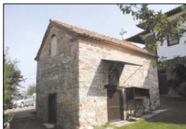
Църквата „Св. Димитър“