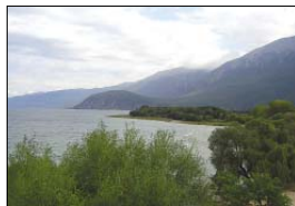
Охридското езеро и планината Галичица