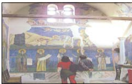
Манастир следва откъде езерото

На малко ниво над тези збири се издига манастир-крепост, от който се открива чудна панорама към Охридското езеро. От жилището на св. Наум знаеме, че той се е родил вероятно през третото десетилетие на IX в. в областта Мизия, т. е. в старите български земи. Бил е един от най-близките ученици на светите братя Кирия и Методиј. Когато с тях посетил Равн в края на 867 г., бил разположен за превзетел (геромонах). След смъртта на св. Методиј устоял да достигне до българската столица заедно със св. Климент и Анастасий. Тук във участие при основаването на Преображенската книжовна школа. След 893 г. бил изпратен да замести св. Климент Охридски в просветелската му дейност в областта Купленевца в Македонија. Ръководил Книжовното училище в манастира „Св. Пан-