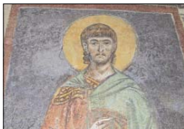
„Св. Наум“ – мозаично панно