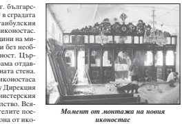
Монити от иконостаса на новия иконостас