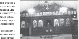
Новият иконостас и монити в извършените работи