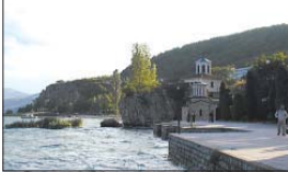
Манастирът „Св. Горгониця“ при Калища

От Охрид търпяваме на северозапад покрай брега на Охридското езеро. Пътняваме през плодородна низина в която има много ниви, млязови, оводни извори и лозя. Преминяваме през няколко села и тамплет постепенно се приближава към брега на езерото. Тук мот е нисък, бялост и обрасла почвата Беритицакски скали на Варовикова Маира планина, върлу която се наричат светлата Камни и Рагорка. Тук в пешерата и допаметни издубани кляма и разположен стар манастирски комплекс. В скалите има при пешерата църкви – „Св. Архангел“, „Св. Атанасий“ и „Св. Власий“. По поречието църква са построени манастирски сгради, които