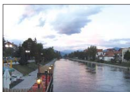
Вечерни Струга и река Тзира Дрин

женията са безобразирани от рабонически рун. Алчип образите на св. Атанасий, на св. Нерон, св. Пента, св. Марна и др.