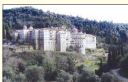
Манастирът „Св. Георги-Зограф“ – панорамен изглед

Това, което най-вече ме впечатли и дълго ме обиднаше, е доктрумент живел в Зографския манастир. Манастирското братство е пораснало – има 19 монаси и иеромонаси и 13 послушници от