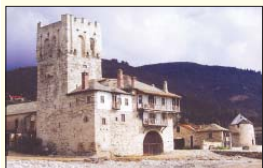
Пристижието на български Атанасий манастир