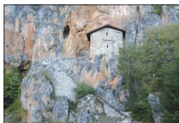
Скалният параклис „Св. Атанасий“

На половин километър разстояние от манастира, в непосредствена близост до албанската граница се намира скален параклис „Св. Атанасий“. Той е издубан на височина 30 м и до него се стига по дрифтени стъпки (сега каменни, с метални перила). Той е изписан цялостно, но изобраз