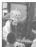
На Велики четвъртък, след отслужаване на св. Величката литургия в Великия малосвет, митрополит Николай прие в двора на митрополитския дом над петдесет деца от домовете за сиринци, пасено с когото бодисва червени великденски яйца

Същия ден от 14.00 ч. на спарийският архиепископ в съслужение със свещеници от всички пловдивски хра-