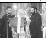
Посвещаване на 12-те свещила на Велики четвъртък в патриаршеската катедрала „Св. Александър Невски“. Негово Светейштво Българския патриарх Максим чете първото евангелие. Просвещените епископи Стойбишки Наум и Зеленолски Йозан вземат Кръста на Христовите страдания