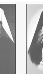
Митрополит Методиј (Кусев)

Първата публикация „Социално-етическите възгледи на митрополит Методиј Кусев“ (Пярнов, 2003) е замислена от автора като онит да постави един от най-важните социално-етични проблеми, разглеждани от митрополит Методиј Кусев, а именно възпитанието и образованието, които имат основополагащо значение за формирането на човека като духовно-нравствена личност.