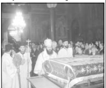
За особия работен на клира и богомолния търпелив патриарх Максим огънят богослуженията на Велики четвъртък, Велики петък, Пасхалното богослужение и на Второ Възкресение