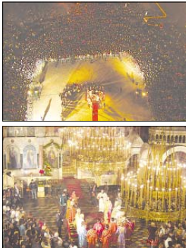
Множеството богомолци, изпълни патриархската катедрала „Св. Александър Невски“ на площад пред нея, върши посрещането на Благодатния огън

точната страна на ротоцата на Гроба Господнеца, и в литийно шествие, с хоругви, невяи и митрополити от духовници, сред които и нашите митрополити, при пененето на „Свете тихий“, обиколи трите пъти малкия храм над Божия Гроб и влезе вътре в 13.55 часа. С приртен дъжд поклонниците очакват чудото.