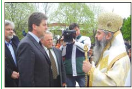
Варненският и Великопрелаският митрополит Кирил покрещени в първородната Панагрия председателя на страната Георги Първанов

На 1-3 май, с благословението на Невзобо Свемедшество Българския патриарх МАКСИМ, по решение на Свещен Синод на Българската православна църква в СФЕП