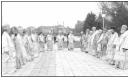
Архидиаконите и свещенството от поместните православни църкви взеха участие в разпичаване св. Литургия