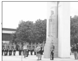
Монументът на св. цар Борис е с височина 11 м и широчина 2 метра. В държавния и изграденият се изградението на околопото пространство 120 000 лт. Проектът е дело на архидиакон Димитър Кръстев и скулптората проф. Борис Кютов, а изпълнението е на соборския филар