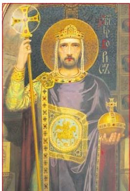
Св. цар Борис-Покръстител. 1100 години от успението му. Икона от патриаршеската катедрала „Св. Александър Невски“

„Господи ще даде сила на Своия цар и ще въздигне роса на помазанника Си“ (1 Цар. 2:10)