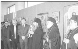
В Шуменския исторически музей бе открита изложба „Християнската култура в България“