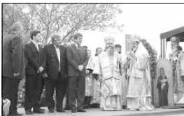
В края на богослужението митрополит Кирил одава Патриаршиското и синодирате послание по повод юбилея