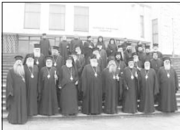
Архидиаконите и свещенството от поместните и във Велики Преслав

и синаодирате организации, и обединени управители, комитетове от региона и много гражданци, които въпреки неколкократните метеорологични и работният деноуха да почетат личността и делото на Великия държавник, покръстител и разветел за духовната просвета на св. цар Борис. От името за всички институции и организации бяха посрещени Венци и шеделте при монумента на св. цар Борис.