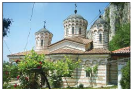
Главният манастирски храм, посветен на Свещата Единица и Неразделна Троица

Патриаршеският манастир „Света Троица“ се намира в подножието на величествен скален венец на 6 километра северно от средновековната на столица Велико Търново.