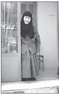
Разговорите за красота са изшуми. Нарадуваха зарпаната.

Спиращата Гавриила е една от най-известните в православно-свет мислителки и духовни мислители. Целият ѝ живот е отреден на монашество и грижата за страдащите.