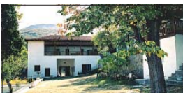
Входът на Кукленския манастир

Светата обител е разгрупавана на два пътя, като през 1657 г. е единствената оцеляла по време на помохамедянщината на родописците (чинските) българи, кога-