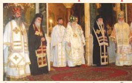
Синод, Левкийски Павел, Деволски Теодосий, Маркианополски Константин, Знепловски Йоан, архимандрит Борис, игумен на Бачковския ма-

С тържествена св. Литургия в храм-паметник „Св. Александър Невски“ беше отбелязана на 36-годишнината от интронизацията на Негово Светейштво Българския патриарх Максим. В богослужението, оглавено от Негово Светейштво, взеха участие високоросенските синодални архiereи, просещените епископи Стойбишки Наум, главен секретар на Св.