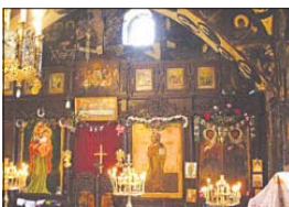
Интериор от манастирския храм

до 33 манастира и 218 църкви между Костенец и Станимака (дн. Асеновград) са сградени до осемнадесетте години на XX в., след което последователно са изгорени половината от северното и цялото южното крило. Сега са съхранени западното крило и част от северното.