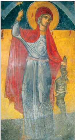
Степанос от църковата „Св. Петка“, с. Вуково, Костендиковско, XVI век

Първоначално с дърветата на дествът доведе си се тълкува с итепанети, Аларма; оларема – с кръста на мъченичеството, преследва се от чудесни изцеления, благочестно си приела поведени мечети за твните страдания.