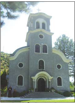
Храм „Св. Иван Рилски“ в гр. Кресна

Качихме се там по тъмно и останахме да спим в манастирската града. На сутринта и изгрева на слъ-