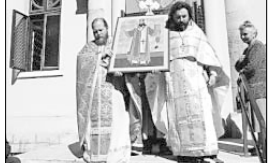
та иконата с моштите на светитец Димитрий Ростошки.