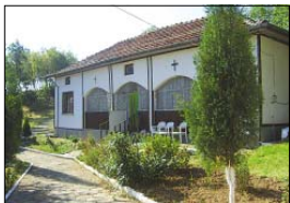
Манастирската града и параклиът на Горнобистришкия манастир „Св. пророк Илия“