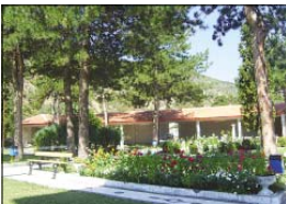
Изглед от въвора на храма в Кресна