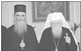
в откриването на Седмичната на православната киня, която се провежда във Варна от 3 до 9 септември

На 4 септември Негово Светейшество Българският патриарх Максим се среща с Черногорско-Приморския митрополит Амфилохий (Рагужин). На срещата са присъствали Стойковският свещ. Нам, главен секретар на Св. Синод, в изпослският списък Иван, викарий на Софийския митрополит. Създадени митрополит Амфилохий посетил Велико Търново и храма „Св. 40 мъченици“, в който е бил погребан големият гръбски светец св. Сава. Митрополит Амфилохий взе участие