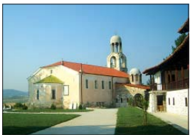
Манастирският храм „Св. Георги Победоносец“