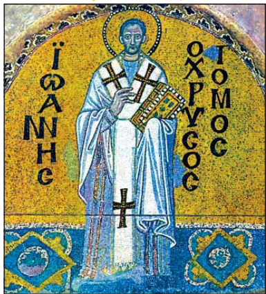
„Св. Иоан Златоуст“