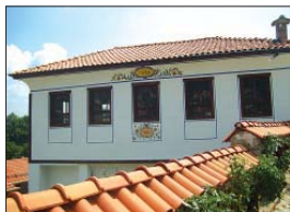
Килийното училище в с. Тешово

Църквата е под самия площад. Редом с нея е разположено килийното училище, свързано с храм с покрив проход, по който дената лесно са отивали в