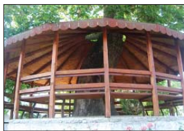
Беседката в двора на манастира