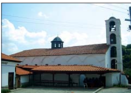
Църквата „Св. Димитър“ в с. Тешово