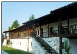
Северното крило на Хаджидимовския манастир