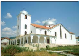
Църквата „Св. Георги“ от 1898 г., с. Гърлян