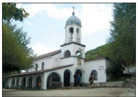
Църквата „Св. Георги“ от 1995 г., с. Мусалим