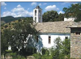
Църквата „Св. Николай“ от 1847 г., с. Ковачица