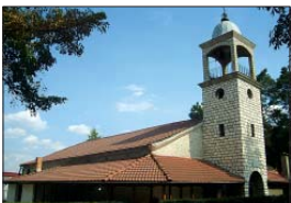
Църквата „Св. Николай“ от 1835 г., с. Мусалим