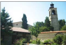
Църквата „Св. Троица“ от 1850 г., гр. Банско