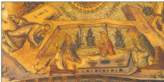
„Въведение на св. Богородица в храма“, Мозаика от манастира „Хора“ в Истанбул