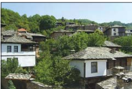
Изглед от живописното с. Ковачица