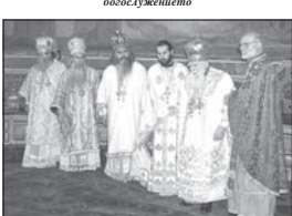
Патриарх Максим с архиереи и духовници по време на апостолското четиво

предължия в приемния салон на Синодалната палата. Там първо беше изпитаното многолюдното на новоръководения архиерей.