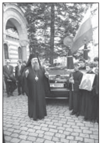
Сетиаршесте и тжжа „Доместен“ за своят ректор