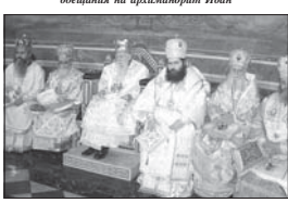
Патриарх Максим и архирейи в олтара по време на апостолската четиво