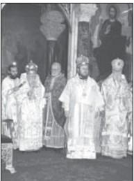
Българският патриарх Максим и новоръкоположеният епископ Наум благославят болшоците в края на св. Литургия