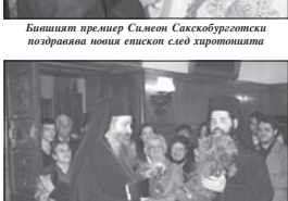
Архиепископ Антоний поздравява Великия епископ от името на Пловдивската семинария

ществените прояви – привлича интереса на цялата на обществост, идващият и широката на духовното учение, а заедно с това и Вашите.“