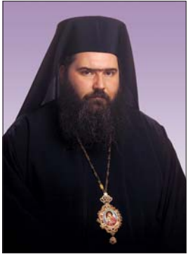
† Знеполцки епископ ЙОАН

На 17 март 2007 г. в храм „Св. Александър Невски“ е хиротонисан с титлата Стобийски епископ.