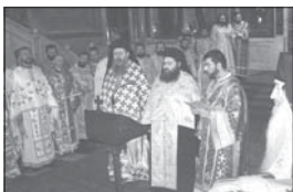
Манастир от вероизповедана в архирейските обещана на архимандрит Йоан

В края на богослужението беше изпето химновете „Св. Младята лета“ за започна и краткото тържество в приемния салон на Синодалната палата. „ Боже дай благослови