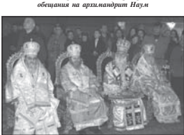
Част от синодалните архиереи в началото на св. Литургия