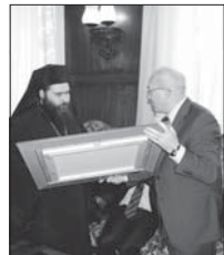
Министърят на отбраната В. Витанков поднася картината на епископ Йоан

Поздравително към новоръкоположения Знеполски епископ Йоан, произнесено в ИКХХП „Св. Александър Невски“ след Божествената светна литургия на 18 март 2007 г.