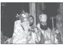
Българският патриарх Максим и епископ Йоан благославят народа

неделия път на епископското служение на новия архирей“ – каза патриарх Максим.