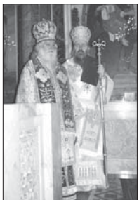
Епископ Сионий със своите духовни старци Видинския митрополит Дометиан

Поздравително към новоръкоположения Велички епископ Сионий – ректор на Софийската духовна семинария „Св. Йоан Рилски“, проповядва в ИКХП „Св. Александър Невски“ след Божествената свята литургия на 24 март 2007 г.