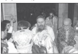
Облагането на новоръководения епископ със силноста на архиепископското служение