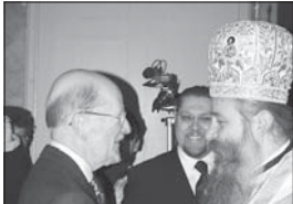
Божият прелер Симеон Сакскобургготски поздравява новия епископ след хиротонията