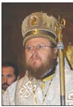
Стойбийски епископ Наум