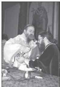
Новоръкоположения Велички епископ отслужва първата си архиерейска св. Литургия