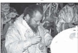
Общването на новоръководения епископ Наум със синодалите на архиепископско служжение