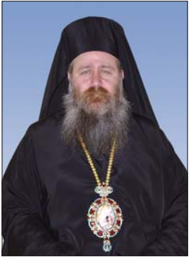
† Велички епископ СИОНИЙ

На 18 март 2007 г. в патриаршеската катедрала „Св. Александър Невски“ е хиротонисан с титлата Знеполцки епископ.