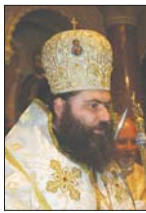
Зепхаиски епископ Ион