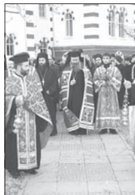
Епископът ще постриват тържество в Софийската духовна семинария