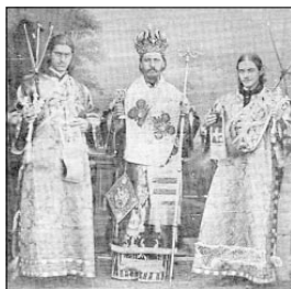
Новоизбраният Самоковски митрополит Доситей със своите дякони, 1872 г.

отказва от ведомството на Цариградската патриаршия и се присъединява към новоучредената Българска епархия. На 25.05.1872 г. в Българския храм „Св. Стефан“ е канонически избран и заротворен за Самоковски митрополит от Българския епископ Антим I архиепископ Великозарски Иларион (Макариополски), Пловдивски