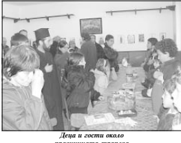
Деца и гости остана доминантна празничната програма

— Това е друга моя задача. С този проект исках