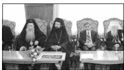
В приемния салон на Синодалната палата

Ваше Светейшество, Ваши Високоспреосвещенства и Преосвещенства, Боголюбиви отци, Възлюбени в Господ, братя и сестри,