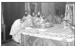
Новият епископ прихваща свещениците