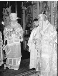
Патриарх Максим поздравя другия митрополит – Русокият митрополит Неофит