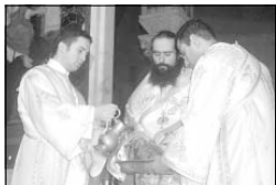
Църковна литургия на епископ Даниил в качеството му на архидиакон