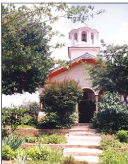
Изглед от западната страна на храма