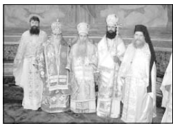
Епископ Даниил с духовния си отец Неврокопски патриарх Натанаил, Славонския митрополит Новицки и свещеници