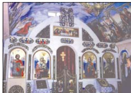
Иконостасът на храма