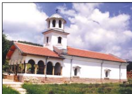
Манастирският храм „Св. вмчк Теодор Стратилат“