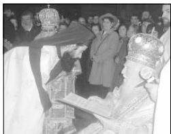
Нареченият за епископ архим. Даниил влиза в благословение от патриарх Максим.