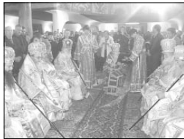
Синодалните архирери по време на хиротонията и началото на свещата Литургия