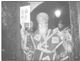
С възгласи „Господе!“ имп. Иоанкии връчи символите на архирейската власт на новия епископ