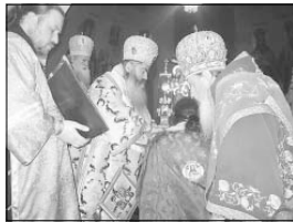
Нареченият за епископ пред св. Престола непосредствено преди ръководяването