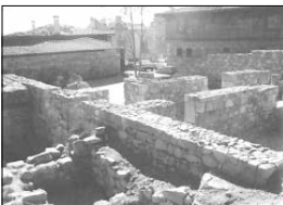
Средновековен християнски комплекс в Созопол, открит наскоро в центъра на града

За утвърждаването на Созопол като един от най-важните християнски центрове по Южното Черноморие през XIV-XV вв. голяма роля играе името на местните жители в района: