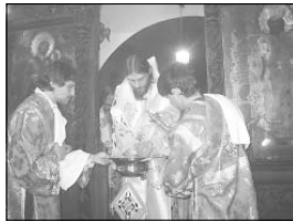
Прочитани св. Ипатийа по време на въртата си св. Литургия като архирей