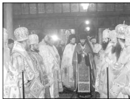
Нареченият за епископ двама тържествените обичаята за достояно архирейско служение

Получавайки епископския жезъл, винаги помни, че този жезъл е, за да пасеш повереното ти Христово паство. За верните и послушните нека той да бъде сила и утвърждение, а за непокорните и лицемерните ти го употреби като жезъл за възмущение и подкрепа и като жезъл на наказание. Амин!