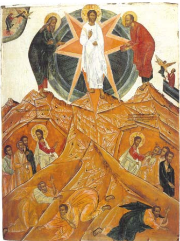
„Преображение Господне“. Руска икона от XVIII в.

Планината Тавор – планината, на която е станало славното Христово Преображение, обикновено на иконите се изобразява като скалист връх. Всъщност тя е идеална куполова форма. Висока е 588 м и склоновете ѝ са пълно покрити с дъбове и орехи. Много събития са свързани с планината Тавор, защото тук се срещат различни пещища и тя е важен стратегически пункт.