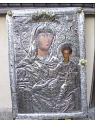
Чудотворната икона на св. Богородица

градската патриаршия. Наричали селото „Майка Елава“. През 1924 г. по споразумение „Молдов – Кафадарски“ местното гръцко население е изселва в Гърция, а так прегинат про-