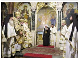
Момента от съвместното богослужение в патриаршеската катедрала „Св. Александър Невски“ в София