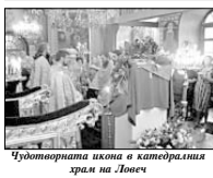
Чудотворната икона в катедралния храм на Ловеч

В България Боянската чудотворна икона се преходна на 12/25 септември.