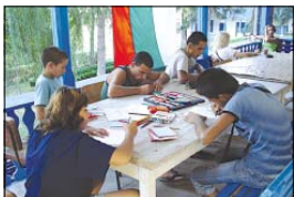
С децата бяха проведени различни занимания. Рисуването беше сред любимите дейности по време на лагера