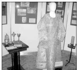
Изложба с църковни одежди на Епархиалния и Националния църковно-ортодоксалски музей в София. Изложбата „Дяконът“ е открита на 21 май и продължи до 18 юни. Тя е посветена на 135-годишнината от обещаване на Васил Левски

Преди обиколка на Венедикт (19 април 1864 г.) Дякон гостувал заедно с приятеля си Христо Пулчиев на отгованото първо на провинция певец от храма „Св. Богородица“ хаджи Георги Ноа Василев. След това тримата отишли на гости на