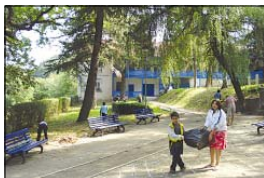
Малкушовете вложиха с радост и почитание на обичайния манастирски двор