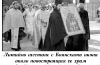
Литийно шествие с Боянската икона около новостроящия се храм „Св. Кирила и Методий“ в Ловеч

след което Боянската икона беше отнесена на Боянската църква за поклонение от християните.