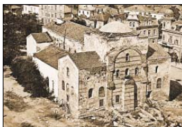
„Св. София“, снимка от 1920 г.