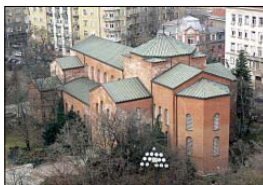
Храм „Св. София“ днес