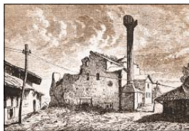
Църквата „Св. София“ през 1871 г. Графика от Феликс Канц