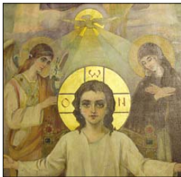
Детайл от храмовата икона „Св. София – Премърлоост Божия“

През 1818 и 1858 г. силни земетресения сериозно повредят масивната постройка. При второто земетресение паша минарето и убива няколко молотници, затова я изоставя. След Освобождението софийците използват старинния храм за склад на гата, с който се палили дупините лампи; а след събирането на часовниковата кула (3 януари 1882 г.) външ църковния покрив слугил вилка за противопожарни наблюдения. След полгането на основния камък за строителството на храм-паметника „Св. Александър Невски“ имало недостиг на строителни ма-