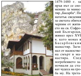
Нювата жилищна сграда на манастира

След османското нашествие скалните килии и църкви запустели. В османски данъчен регистър от 1479-1480 г. за първи път се споменават манастир „Басарба“. По нататък сведенията за сватата обител черпят от житието на св. Софроний Български, живял през XVI в., като монах в Басарбовския манастир. Загнал от наследствената смърт в манастира. След потресеното започнали да стават чудеса на гроба му. На третата година отворили гроба и открили моштите му измелени и благоухани. Сега те се покорят в Сърбия.