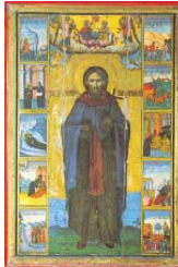
Икона на св. Димитрий Басарбовски от 1803 г.

Св. Димитрий бил пастир на с. Басарбово, приел монашество в Басарбовския манастир. През земния си живот прославил Бога, а Бог го прославил във вечния. Св. Пансий споменава за година на успешното му – 1685. Моштите му били открити по чудесен начин в р. Русенски Лом, срещу манастира. При тях ставали много чудеса и изцеления.