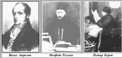
Васил Априлов Неофим Рилски Петър Берон

ката на словото си той изтъкнал от какви народни дейци се нужае днес българският народ за своята обнова и добри будини.