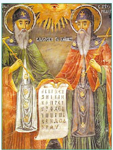
„Св. Кирил и Методий“.

ХАЗАРТЪТ КАТО СТРАСТ Има ли надежда стр. 7