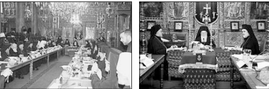
Представителите на Полските православни църкви по време на заседанията, проведени в Истанбул. Заседанията бяха председателствани от Вселенския патриарх Вартоломей II

3. Въздействието от учението и делото на св. апостол Павел, отбелязвайки преди всичко важността, която има за живота на Църквата и за служението на всички ни задължение, за помисля, съгласно посланието на Господ: „Това благославенство на народа Божия, но и на невярващите в Христос е въведено дъщеря на Църквата. Този дъщеря да се изпълнява агресивно или чрез различни форми на прозелитизъм, но с любов, смирение и почит към личността на всеки човек и към културното своеобразие на всеки народ. В тези мисионерски усилия трябва да участват всички Православни църкви, уважавайки каноничния ред“.