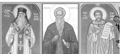
Св. Софроний Врачански Св. Йоанн Рилски Св. Пансий Хилендарски

Кънека е час, в 8:00ч по-голямата част от насечението се отпрепят като християни, макар биващо от тях да посещават храма само по големите празници. За принадлежките към сивата се смятат едн зрла от роженски проповядатели, семействата с турско самоземане. През 2005 година сгр ромите Вилчак в броежките за построяване на грама. За погемно от хората, запознати с осъществяването на таква проекти, е ясно, че в Сивата сграда Вилчак е необходим за построяване на сивата сграда, а за усъвършене на сградата. В декември си да се докажат, инициаторите спизват твърде даем. Те претенцират драмата да се биде построяна на един от хамбоните над сградата, над архиепископ, така че да се видица от целия град. В този момент никой не може да бъде съвсем сигурен време от минирето на тази проекти-