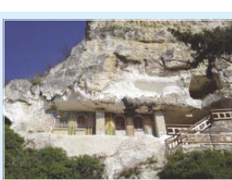
Общ изглед от манастира