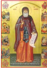
Нювата икона на св. Димитрий, подарена на св. обител през 2005 г. от патриарха Константинополски. В нея е изградена частичка от моштите на свещта

През 1774 г. завършила му минавал път от много русотурски войни и в с. Кюмук Кайнарджа бил подписан мирен договор. Русия била победителка. Казава в догата давала право на Русия да покровителства православните християнства на територията на Османската империя. Моштите на св. Димитрий Басарбовски били пододарени на Русия в знак на благодарност. Генерал Николай Салтиков трябвало да ги пренесе в Русия. Пътят му минавал през Букурещ. Там стигнали на 13 юни 1774 г. Тогава в града имало много синадени. След като моштите влезли в Букурещ, никой повече не умрял от страшната болест. Жителите изпросили от генерала да остави моштите в града. И до днес те са там – в Патриаршеската катедрала „Св. Константин и Елена“.