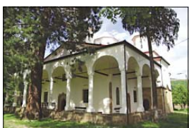
Манастирският храм „Св. Йоан Предчик“