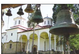
Калубите в двора на манастира