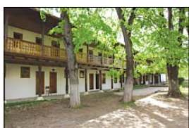
Юзотно храм на манастира