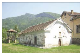
Църквата „Св. Троица“ в с. Долна Лала