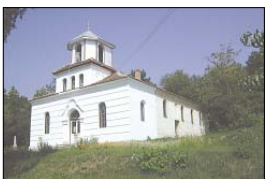
Храм „Св. Георги“ в Белградчик