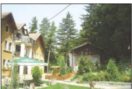
Новата сграда и храмът на Изборския манастир „Успение Богородично“