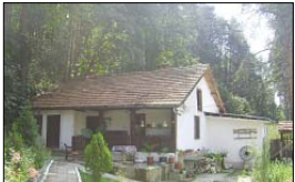
Старата сграда на Изборския манастир

На други ден се качихме при Белградчишката крепост, видящата като естествено продължение на скалите. После поехме към нецерата Магурата, а оттам се отпращихме към