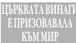
Поседеното интервю на Александър II, патриарх Московски и на цяла Русия. Интервюто е вестко а храм на октомври 2008 г. за телевизионния канал „Вести“.

– Гоненията вече не бързат да си отидат, а стрелба, но велият първоцветстване живот беше под контрол. Вие наши обикновени и републики дори промените в закона, а се представят в определени за това места за проверка от представителите на Съвета по религиозно-нравствени въпроси, които най-често бяха отсъдени, определяха какво свещенник може да бъде и какво – не.