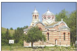
Храмът в гр. Брусарци