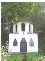
Камбанарицата на манастира

мента взимат това не леко решение. Сега оспен за храма в Белградчик, младиот свещеник отговаря за оне 30-40 църкви в тази духовна околна, в които има само оне двама свещеници.