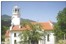
Храм „Св. Николай Чудотворец“ в с. Желена