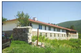
Чипровският манастир „Св. Иван Рилски“