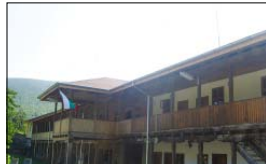
Монашеското криво на манастира

– „Местното население“ са о тежи тримата – сочи той тримата мъже, седнали край него на чардака, – аз так позивам по нима. Следващата ни спирка е Раковнишкият манастир. Нищо не зная за този манастир и никога не бях ходила там, затова много държах да го посетя. И отново дена разговарях редовно с игумена, за да координираме плановете си. Той пътуваше със свои събрат за храмов празник в родиното си