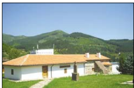
Църквата „Св. Възнесение“ в гр. Чипровци