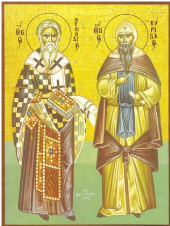
„Св. Кирил и Методий“ – старейшина икона

С в. Константин Философ, свет като пропитуват Виназко земна като патриаршески мислионер и просветител на Православие, по време на последното си пътуване – до Рим, забавява постолю. Но Всевластен Бог му изправта небесна утеха чрез някакво дивно Видение, което укрехило сърцето му и го изпълнило с несбъдващо-Вена радост, така че той сред болящите си започнал да пее паскаловия стих: „Зарядих се, когато ми казана да иже в дома Господен“ (Пс. 121:1), като при това казва: „От сега вече не съм сужките ни на царя, но на друшето по земето, но само на Бога Всевържителя“ и църквя