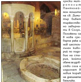
Киборийт с каменния лесен в крптата

На 24 октомври 1978 г. благоустроение на покойния Со-