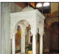
Киденетиат – гроб на светеца

и чрез него отпади, кошто до гроб, киденети към крптата, кошто към кибория на християнската базилика. Заповя и изпичането на миро-то се сврещва с ржката и сребнято миро изпича-