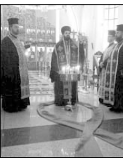
православен център „Чисти сърца“.