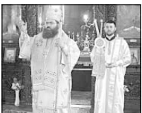
святите, жертвали живота, дори живота си, за да пребъдят в Бога.