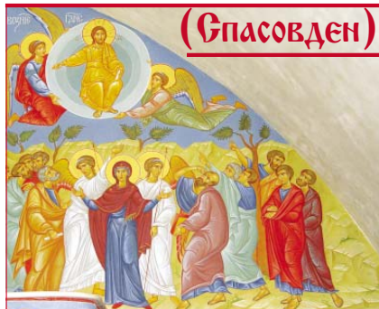
Съвременен стенопис „Възнесение Христово“ – Лора Малева