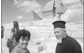
С презрителна Еквотора пред сфинкса

Та нази, ако Бог беще дал наготово съвършеното богоподобие на човека, то в своето съвършено поведение човекът да бъде само един с това определени задачи, без лично поведение и свобода на извак или другите, т. е. без да може да бъде творец. Зашто на практика човекът щеше да се намира в състояние, в което винаш да може да бъде човек, тъй като човек без свобода не е човек. Без лично поведение, без лично