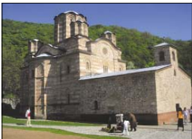
Манастирският храм „Възнесение Господне“

Ако си припомниш житието на прп. Ромил Видински, ще разбереш, че преподобният е по-възршил своя земен път в манастира „Раваница“ в Сърбия и там е бил погребан след смъртта си през 1375 г. Когато прп. Ромил известо време обикалял из манастирите в Браничевска епархия и посетил „Раваница“, потърсих хората на именита ученик на свети