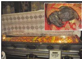
Пелешението моши на княз Лазар

След провъзгласяването на Печката патриаршия през 1375 г. и избрането на патриарх Ефрем, светогорски монах-исихаст, българин по произход, на тери-