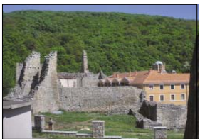
Старите крепостни стени и новата сграда на манастира „Раваница“

Григорий Синит – прпс. Ромил, розом от Биди, днешния гр. Видин. Но колкото и да развитах монахиите и продаваче на икони и сувенири, никой не можа да ми покаже гроба. Нещо повече – дори не помруваха за кого ги питам. А гробът на преподобния се оказа в притвора на самия храм, в специална ниша в южната страна. Разноша го по иконата с грижливо поддръжкото горшио календо на него, но не нахисът гласе: „Прп. Ромил Раваницки.“