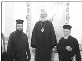
Монумент от срещата с Негово Свещенство Теодор II, папа и патриарх на Александрия и цяла Африка

Бог обаче не провежда промисля си чрез човеколюбивост. Затова ми внушава да се задоволявам с това да го прозвоня на страннически кервани – египетски. Там обаче, в Египет, Бог ни дава Осфр да най-верен и прав до фараона държавен мъж. А така от сушанския година доведва в Египет и неговите брати и цяло му. Така в Египет се събира цялото потомство Авраамово, от което произлиза еврейският народ, и този народ се оказва в робство, от което по-късно бива изведен от Моисей (Бит. 37:3-50:20 и Изт. 3:1-12). Нека отбележим так следното: обикновено един народ подчинява друг в робство чрез нападение. Но този робството на евреитек араби не е следствие от нападение на Египет, а от личното, дошло десетина на Яков до решението да убий брат си. Ето че