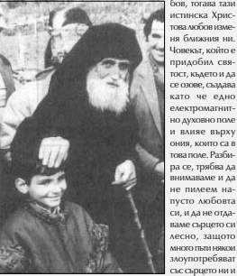
он правят на казва (т. е. наравняват дълбоко сърцето си, мулпотребяват се любя, колкото само провиним към тях — бол. пр.), нем всяко да ми не разберат и не се обиджат.

Никога казва: „Искам и другите да поваят Христа, както и аз го поваях“. И се прави на ученик пред останите. Трябва обаче животът им да е съгласен с това, което учат. Колкото животът си предизказат друг Христос и сами не вършат това, което говорят, тогава не могат да кажат, че не познават Христа. И ония човек не е преживял от опит това, за което говори, ще бъде във от действителност и рано или късно истинното му лице ще се издаде пред другите. Когато те отнесем към някого си съществуване, Бог, тогава така