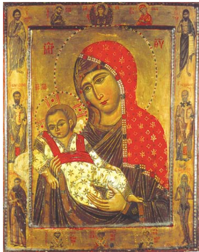
„Св. Богородица с Младенеца“ Икона от втората половина на XIII в., Синайски манастир, Св. Екатерина“