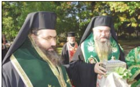
Адрианополен епископ Евлогий и Зиевски епископ Иван при представянето на мощите

В съботния ден, на 17 октомври, най-голямото престоятели и свещенослужители на софийския храмове, игумени на парихийския манастири в Москва, местното духовничество и граждани на гр. Перник, преподаватели от Зиевската епископия Русия, тръгнаха с литийно шествие от храм „Св. Йоан Рилски“, за да посрещнат тържествено в центъра на града частца от мощите на св. Йоан Рилски.