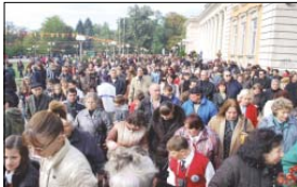
Стопници перничану посрещат мощите на св. Йоан Рилски Чудотворец

Рило-манастирското братство и от мо епископ молихтвено благопожелаван на всички перничану да бъдат достойни за тази свещитна, която сега представяме, която живее с искрено вярва, с мъдрост и боготворен живот“.