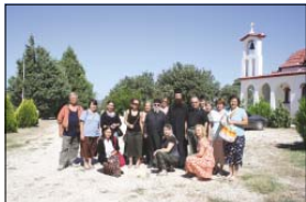
С изкумена на манастира „Св. ап. Йоан Богослов“, с. Асехори, архил. Нектариис в двора на св. общел