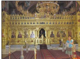
Поземалната икономата на катедралния храм „Панагия Елефтериотиса“, Дидотиини

Колко чудеса са извършили Митиланиско новомъченици тук чрез чудотворната си икона (обичана икона в златни и сребърни пластинки), и чрез чистотата от моштите на св. Рафаил под нас, само Бог и