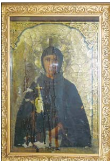
Пачеята икона на св. прмчница Параскева от еконоината параклис в Калотиини