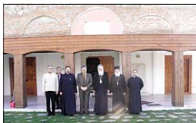
През храм „Св. Константин и Елена“ Одрин