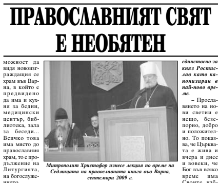
Митрополит Христофор изнесе лекция по време на Събора на православната църква във Варна, септември 2009 г.

– Как гледате на обществените очаквания към Църквата да бъде социално активна, до озидла отношение по истички актуални обществени проблеми? – Как Църквата трябва да се отнася към тези очаквания? – Като на съществена част от служението на Църквата, от грихата ѝ за благодарение да нахран гледища, да поети болнин, да утеша скърбящи, да посети душата си. Това е нещото, което Църквата е правила оне от времето на апостолите, прорава гно и дес. Ай имах възможност да изляза на обществено съзнание на XI в, управлението на Църквата в се вярете на петима патриарси. Това число има своето significance значение и затова, когато от Църквата отиде Римският патриарх възникват териториите за Москва като Трети Рим и Пети патриархат. Но има и други Църкви, които претендират за древност и високост патриархатско доверие и авторитет. Няматме еднозначно какво следва да се определението за автономия и автокефалия, кога сама Църква има право на самостоятелност и кой има право да се отнася за същото право. Всичката патриаршия, Църквата-майка или всички предтежители съборно трябва да поставят подписа си върху акта.