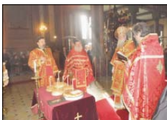
Празнично богослужение в българския храм „Св. Стефан“ в Истанбул

На 27 декември, Стефановден, председателът на българската фондация „Св. Стефан“, който се грижи