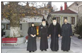
В двора на храм „Живописни източник“