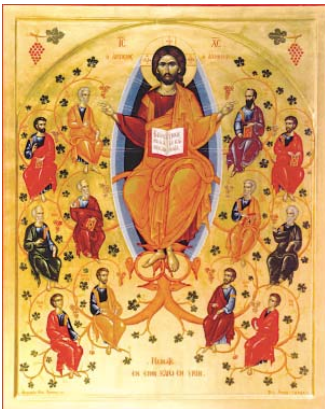
Аналошна икона „Лозата Христова“

Продължава с още по-голяма настойчивост и старание усилията за въвеждането на задължителна подготовка по предмет „Религия“ с профил „Религия-Православие“ в българското училище. С извешта върхост, духовна загриженост и отговорност прегр скарта ни