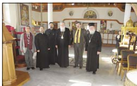
В българския храм „Св. Георги“ Одрин