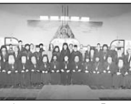
не на Томос за автокефалията.

Този параграф разглежда обявяването на автоке-