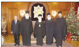
Българската църковна делегация на официалния прием във Великата патриаршия

По време на престоя си в Истанбул българската