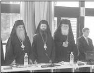
Българската и сръбската делегации