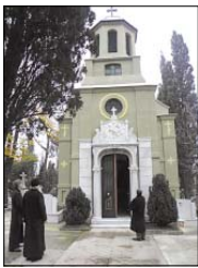
Храмът „Св. Димитър“ в българските гробища в Истанбул