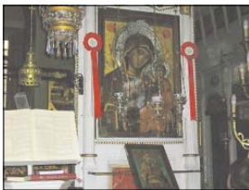
Чудотворната икона „Св. Богородица – Акактисет хми“, Ксанти