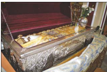
Целият манастир на св. Григорий Богослов в с. Неа Карвали, Капана

Гледаме звездите по нашето небе. Те наистина третат в особен хармоничен ритъм. Слават своя Създател. Показно на так третат и пламчетата в неугасимата кандила на малкия храм. Това свято място остава завинаги в сърцата ни!