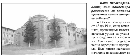
Храмот на манастира „Пантократор“