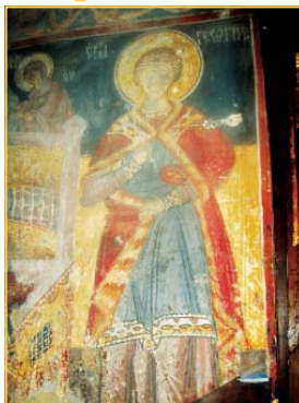
Св. Георги Софийски Нови, стенопис от манастира „Благовещение“ в Овчар-Кайбарската клисура, Сърбия

Вероятно първата изобразяване на светеца са се появили в София, но нито тук, нито в околностите са запазени негови ранни изобразения. Но Вестта за мюмчествата му смърт навярно е спяната бързо до рогия му град Краково, защото първите датирани образи на светеца се намират именно там. Краковската икона Димитар Пепел, щедър дарение на манастира, поръчва да се изобрази Адам на св. Георги Софийски Нови в църквата на Теличанка манастир,