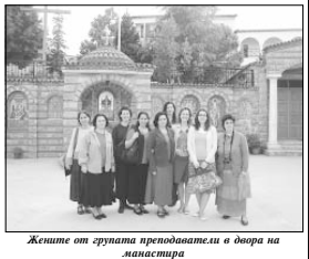
Живете от групата преподавателите в двора на манастира

Ето част от въперещите, които му зададохме: