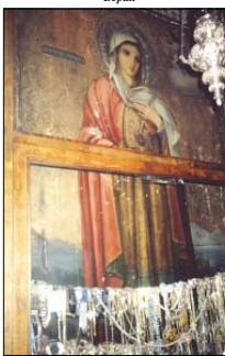
Икона на св. Анастасия Узорешителница от едините манастири

всичко зависи от виргата ни. Ние тръгна да възлюбим цялото си упование на Бога, да отсечем колата си и да казваме като светителя Лука: „Господи, да бъде Твоята воля!“