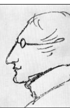
„Николай В. Гогол“.

В избрания път на надбление на човешката душа ласкавост, неискреност, сребролюбие, неувствителност, користелност, прищивност, човекоутоимчивост, ласкавост, ласкост, рупничестост, коварство, бескрамие, насмивливост, скритост, разкопие, лекомислие, страст към власт, а в скли дребен изиле и перчене с физическата си красота, непрекъснато ходене по обсии, вечерни и бляве, казартни игри и др. Геронте на Гогол един друг се критикуват, заведат си, надхитрат се, мамат се, ласкаят се, предизказват, седи над друг и т.н., и по такъв начин всеки си е оказва съвски сянки и онама съвски так разрасне. Единствено е, който ги отстъпелъ в вомата апостелъ и не прави съприщане и не изрмитити си за нас сълъи, прошиван в тинирата, разбъркан и колчан да избързи като гер добродетелен човек – ласкав е доблестен от Бога и като е разбъркан с колчан чудна красота на женска душа, изпълна с не-