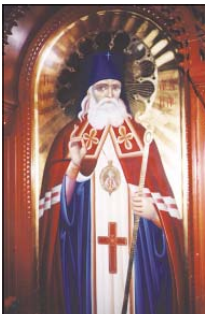
Св. архиепископ Лука (Войно-Исенички). Икона от манастира „Панагия Доира“.

Този чудотворен образ в атинския руски храм се оказал там по чудеси наши. Свети Лука (Войно-Исенички) е явил в съновиение на предтещата на храма о.