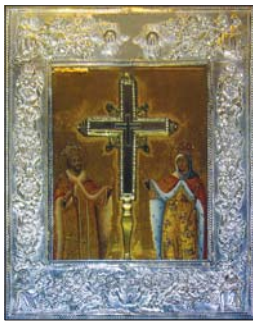
Честната от Животворящия Кръст Господен, израдена в икона на св. Константин и Елена

Честният Кръст остана в храма за поклонение